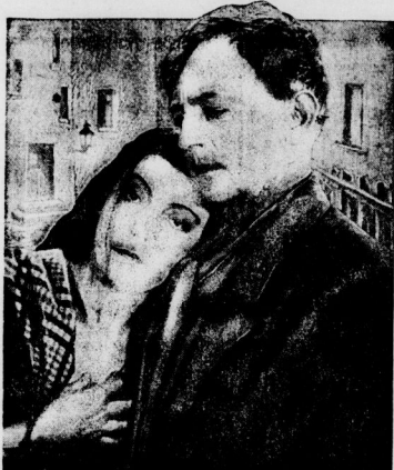
Der Film der zwei Welten!

Der erste Paul Simmel-Großfilm! Der Film der Großstadtgestalten!