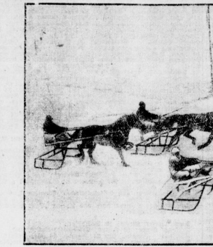
Zum ersten Male fand in Deutschland ein Trabrennen statt, das nicht auf Wagen, sondern auf Schlitten gefahren wurde. Das Bild zeigt einen Moment aus dem Rennen.

recht starken Besuch zu erwarten haben, denn die großen Sprünge (mindestens 2 1/2 m) auf der überhöhten Sprungbahn werden gewiss sehr beliebt sein, die alle Erwartungen übersteigen. Die 24- und 30-Meterhöhen sind ganz vorzüglich. Die Wintererleichterung, zum Beispiel, ist prächtig. Die Wintererleichterung, zum Beispiel, ist prächtig. Die Wintererleichterung, zum Beispiel, ist prächtig.