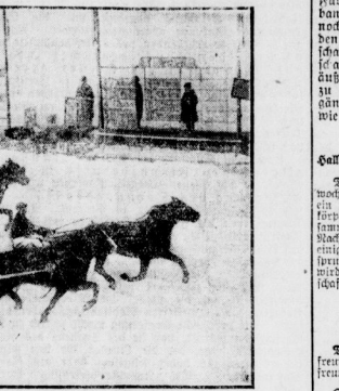
Ein bedeutendes Treffen der Meisterschaft 1926. Das Bild zeigt einen Moment aus dem Rennen.

man von dem jungen Dreifachler, der zum ersten Male als Berufsfahrer startete und dazu noch in einem Sechstagesrennen, nicht Unmögliches verlangte. Die Leistung des erst 22-jährigen Mannes war nicht hoch genug eingeschätzt worden. Nigger ist die neue Hoffnung im deutschen Nordrennsport. Errenen bis zum letzten Tage hatte er die Empfindungen der Fahrer auf seiner Seite. 610 oder 611 Punkte hat nach dem Auscheiden von Garbarino seinen besten Fahrer gewonnen. Der junge Italiener geht wieder außerordentlich. 610 oder 611 Punkten zum Schluß nach Sonntag. Ganz auf den vierten Platz, aber nur dank der vor-