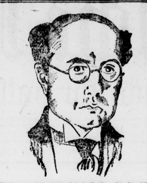
Weging des ... Berlin. Die ...