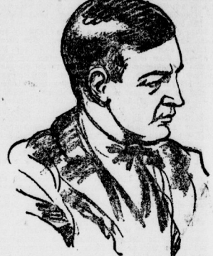
Der Morgen von morgen.

Dieser Red, die jüngste Nacht in Wallstreet.