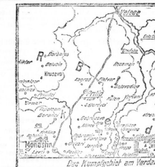
Das Kamalgebiet am Vardar (Kamalia) mit verschiedenen Orten.

Die Besatzung der Argonnen: Die Besatzung der Argonnen hat die Besatzung in allen Zonen auf dem Feind vor unseren Linien zusammengezogen.