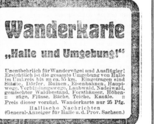
Die Halle und Umgebung (Halle and surroundings) mit verschiedenen Orten.