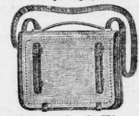
à 3, 3 1/2, 4 1/2, 6 1/2 Mk. u.

Klooss & Bothfeld Gr. Ulrichstraße 8 empfehlen in solidesten Qualitäten Baedeker-Taschen an der Hand und auf dem Rücken zu tragen.