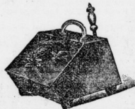
Bis zu den feinsten.