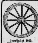
Geprüft 1869. Mit größten Aus- zeichnungen prämiert.

am Leipziger Thor (nicht Hauptthor), Special-Spielwaren-Ausstellung I. Etage. Empfiehlt sein großes Lager in feinem Metall- u. anderen Spielwaren, große Auswahl in Puppen, Köpfen, Kägen etc., Spiele, Bilder- und Märchenbücher. Zu Weihnachtsgeschenken passend empf. seine Garzer Kanarienvogel, Bavariener, Sittiche, Heine Zuegalstufen, alle Sorten inländische Vögel, seltene Vogelbauer bis zum eleganten, Goldfische, Gläser und Ständer, Kanarienvogel und Tiere dazu, nur bestes Vogelfutter für in- und ausländische Vögel. Amelieener und Universitätsvogelkutter zu billigen Preisen.