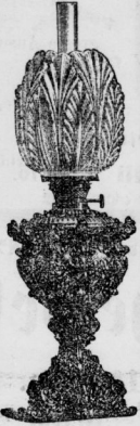
Boudoirlampen in Bronze, venet. Crystal und Majolica!

Von ca. 70 Stück die Wahl! Wagenlaternen fr.