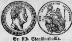
Gr. silb. Staatsmedaille.

alle Sorten besonders gut bekümmert, weil nur aus feinsten Rohmaterialien hergestellt, zum Bezug in Gebinden und Fässeln.