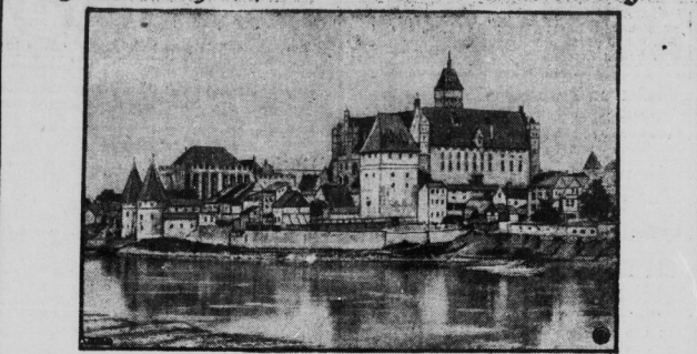
Die Stadt Marienburg in Westpreußen kann in diesem Jahre auf ihr 650-jähriges Bestehen zurück...