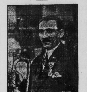
Der Mann, der den Waffenskillstand einübte.