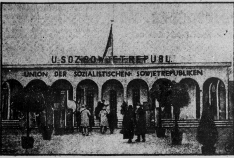
Der neue große Bauhof des „Anton der Sozialistischen Sowjetrepubliken“, der einen besonders reichhaltigen Ausstellungsplatz darstellt.