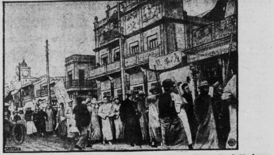
Tsun Ghju, ein Freund der Europäer und Amerikaner, hatte in Peking die Zollkonferenz einberufen, deren Zweck die Abschaffung der ungleichen Verträge mit Europa ist. Diese Maßnahme hat in chinesisch-nationalistischen Kreisen, die gegen jedes Verhandeln mit der Zollkonferenz sind, große Erbitterung hervorgerufen, die sich in großen Demonstrationen dieser Art in Peking (unser Bild) kundgibt.