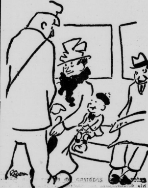
Der Staatspräsident. 'Ni denn der Kleine immer noch drei Jahre?' 'Natürlich.' 'Wie, das scheint auch schon chronisch geworden zu sein!'