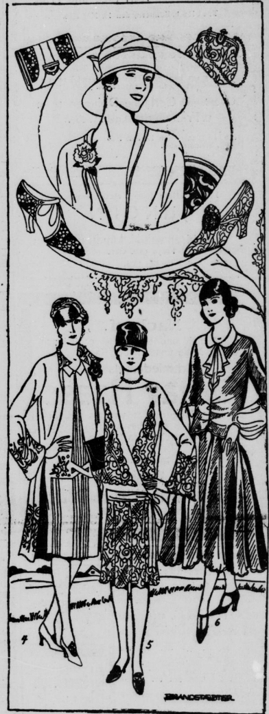
1. Sommerkleid aus schwarz-weiß variiertem und weissem Mouffeline. Rod und abtiedende Stüben aus weissem Material pliffiert. Zumper vorn mit originellem Bolero- und Schärpenmotto.