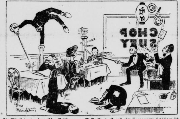
Die Mitglieder der japanischen Kräftigungsgruppe Si-Pa-Sa, im August ohne Engagement, betätigen sich ausschließlich als Kellner.