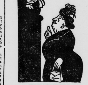
„Ach, was ist mir ein Herr Richter!“

„Aber Sie entsprechen genau der Beschreibung: jung, schlank, elegant, diffinguntig, hübsch.“