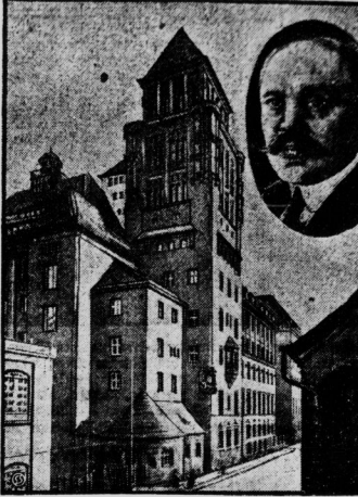
Das Eisentartell perfekt.

Deutsch-französisch-englischer Stahlkartell.