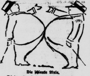
Die Islands Prie. „Schade, alter Freund, daß man sich nie näher kommen kann!“

Ein Mann von der Erde gestürzt. Aus Amsterdam wird gemeldet: Als gestern vormittag ein Pilotenboje bei Kiel (Holland) auf ein Fährboot fuhr, um über den Waaflus übergefährt zu werden, stürzte es in das Wasser und ging unter. Alle drei Insassen ertranken.