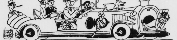
Das Kleinauto der Zukunft. Der Zweiflügel mit adä Räder.

Die in Mittel- und Südfrankreich wütenden neuen Stürme haben an verschiedenen Stellen großen Schaden angerichtet. In der Nähe von Roquebilleire sind nach Meldungen aus Nizza mehrere weitere Erdwaller erfolgt.