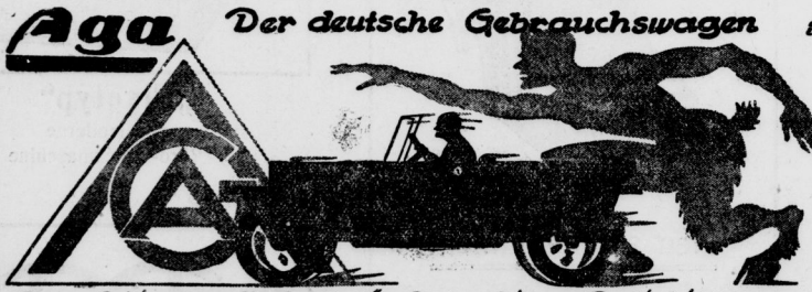
Aga-Actiengesellschaft für Automobilbau Berlin-Lichtenberg.

Der Aga-Wagen ist im armen Deutschland der Wagen des klugen Mannes der Wagen der Gegenwart u. Zukunft!