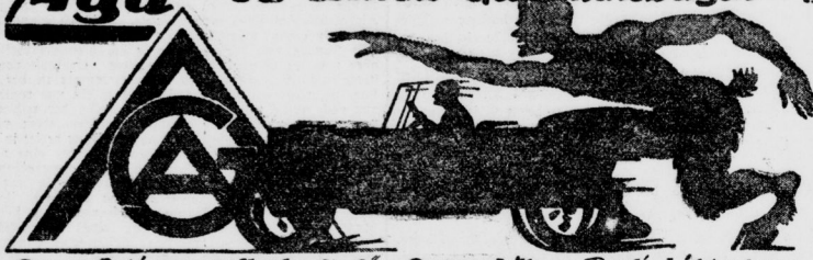
Aga Aktiengesellschaft für Automobilbau Berlin-Lichtenberg.