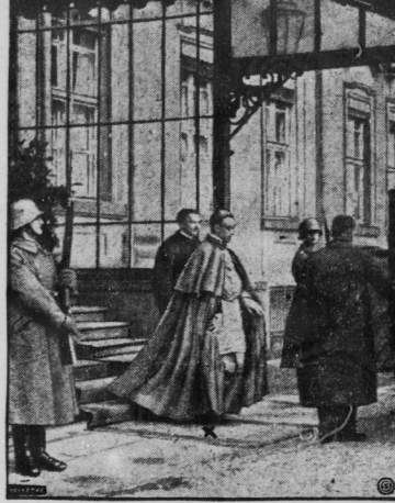
Die Glückwünsche des Diplomatischen Korps brachte der Apostolische Nuntius, Monsignore Pacelli als Dolmetsch, in einer großen Ansprache zum Ausdruck. Unsere Aufnahme zeigt Monsignore Pacelli von dem Empfang der Diplomaten zurückkehrend.