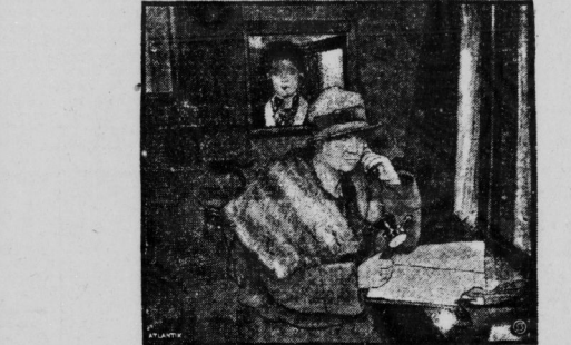
Das Innere einer Telephonzelle im D-Bezirk Berlin-Hamburg. Im Hintergrunde des Bildes sieht man die Beamtin, die das Gespräch im D-Bezirk vermittelt.