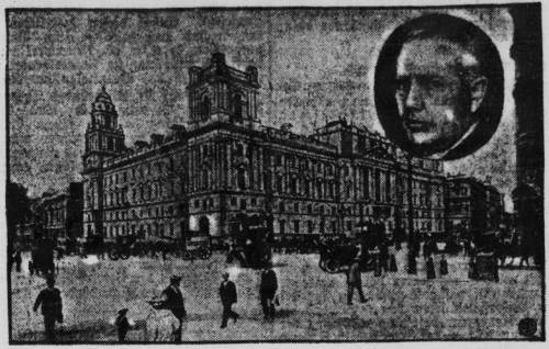
Unsere Aufnahme veranschaulicht den imposanten Bau des Regierungsgebäudes in London, in welchem die verschiedenen englischen Ministerien ihren Sitz haben.