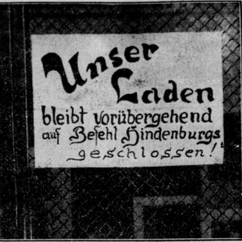
Bilder von der Durchführung des Verbotes der SA. und SA-Organisationen (Sturmabteilungen und Schutzstaffeln) der NSDAP. in Berlin. Unten: Die Tür des Ladens in der Hedemannstraße, in dem sich die Freytagmeisterei befand, mit dem Polizeisiegel; rechts: ein Plakat im Schaufenster des Ladens, das die Schließung verkündet.