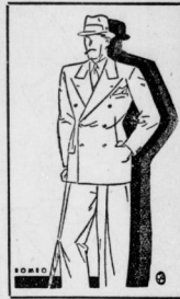
Zweireihiger Saccoanzug auf 2 Knoppaar geknöpft, 3. Knoppaar blind.