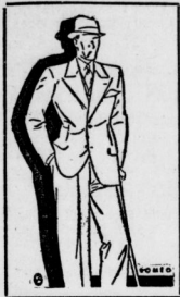
Einreihiger Saccoanzug auf 2 Knopf mit steigendem Revers.