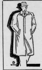
Slipon aus Cheviot oder Gabardine mit verdeckter Knopfleiste.