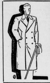
Shetlandpaleot auf 3 Knoppaar geknöpft, leicht tailliert.