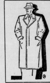
Tailloser Sommerpaleot mit Steppnähten, Revers auch hoch zu schließen.