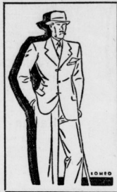
Einreihiger Saccoanzug auf 3 Knopf mit fallendem Revers.