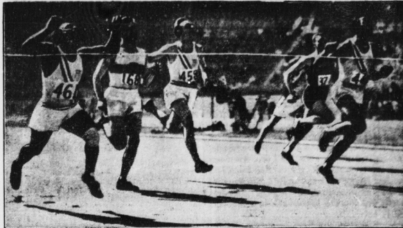
Das Bild zeigt den Einsatz im Ziel der 100 Meter. Von links: Tolan (USA) 1. Jomats (Deutschland) 3., Simpson (USA) 4., Metcalfe (USA) 2. Hinter Metcalfe sieht man den Südafrikaner Joubert, der fünfter wurde, und Yoshitaka (Japan), der auf der Hälfte der Strecke noch dem ganssen Felde gelegen hatte.