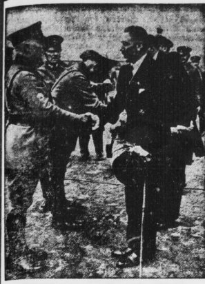
Reichszentraler von Papen begrüßt die Stahlfeldweiser.