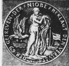
Das harrische Hauptamt prägt eine Gedenkmünze für die 69 Opfer der „Niobe“-Katastrophe. Die Münzen haben die Größe eines Pfennigstückes. Der Entwurf stammt von dem Münchner Bildhauer Karl Goeb.