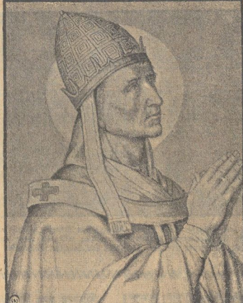
So bekannt und allseitig ist der Sylvestertag, daß in vielen Ländern mit allerlei volkstümlichen Gebräuchen begangen wird...

maffen. Die Verlegungen sind jedoch nicht lebensgefährlich.