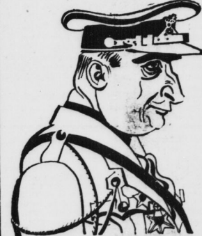
General Primo de Rivera, der spanische Ministerpräsident und Führer des spanischen Nationalismus.

Erst jetzt wird ein neuer Zwischenfall bekannt, der sich am 2. Januar in Weingarten ereignete. In dem Nachmittagsstunden fuhr ein französischer Pionierzug mit 33. Regiment mit seiner Frau in der Straßenbahn von Gonenheim nach dem Weingarten Stadtpark.