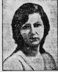
Eine polnische Auswandererin.

ist die Prinzessin Giovanna von Italien, um deren Hand sich drei Prinzen bewerben, und zwar Prinz Wilhelm, der älteste Sohn des ehemaligen deutschen Kronprinzen, Prinz Albrecht, der Sohn des früheren bayerischen Kronprinzen Rupprecht, und Erbprinz Albrecht, der ungarische Thronanwärter.