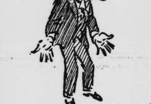
Macdonald, der englische Arbeiterführer, wenn das neue englische Gewerkschaftsgesetz angenommen ist.

Die Tafel des Eintretens für die Enaportator könne Dr. Stresemann, der im Auftritte gewesen sei, in keiner Weise vermerkt werden. Das natürlich sein Einverständnis, da er damals Abgeordneter gewesen sei, vielleicht größeres Gewicht gehabt habe, liege auf der Hand.