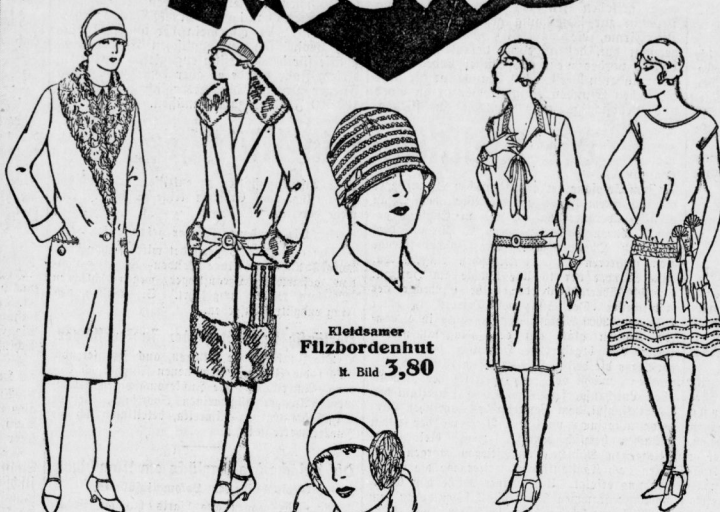
Kleidsamer Filzbordenhut m. Bild 3,80

Fesch und gut ange- zogen ist jede Dame mit einem Winter- mantel aus gutem, warmen Stoffen, mit modernem Plüsch- Schalkragen Er kostet nur 19,75 Preis nur 39,00