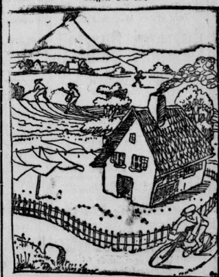
Niemals wird ...