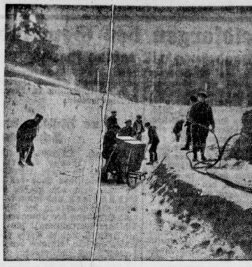
Unter Bild zeigt die Inhaberschaft der Bobbahn durch künstliche Schneeeinlagen in den Kurven.