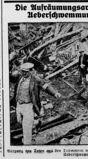
Bergung von Toten aus den Trümmern von Montauban, dem Zentrum der südfranzösischen Ueberflutungsgefahr.