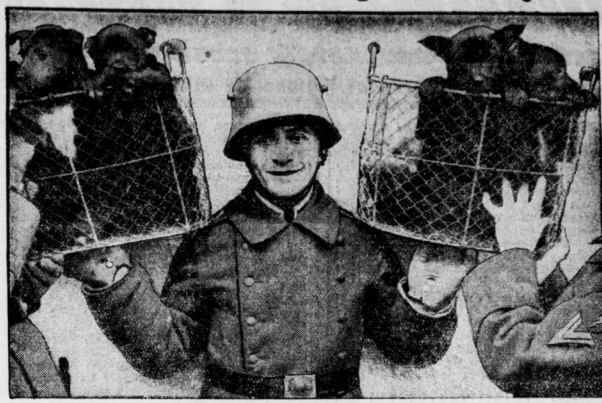
Junge Höglinge der Seereschule-Auswahl

in Kummersdorf bei Berlin, die dort in einer besonderen Abteilung auf Meldehunden ausgebildet werden, nachdem sich im Weltkrieg vor allem die deutsch-n Schifferhunde in der Ueberbrückung von Befehlen und Meldungen besonders zuverlässig erwiesen.