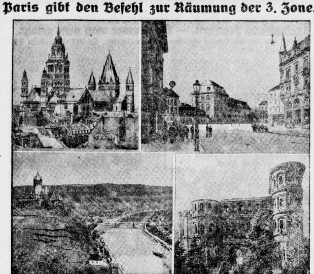
Brand hat dem Reichsaußenminister Dr. Curtius die endgültige Infrage gegeben, das gesamte westliche Gebiet...