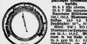
Der Heine zeigt dem heutigen Barometerstand.

Am Montag, dem 2. Juni, beginnt in der Volkshochschule ein Vortragsreihe über 'Einige neuere literarische und geisteswissenschaftliche Probleme'.