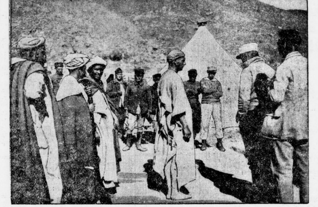
Einbringung eines gefangenen deutschen Deserteurs. Alljährlich lassen sich trotz aller Warnungen noch immer Hunderte von jungen Deutschen für die französische Fremdenlegion anwerben. Es ermannt sie fürchterliche Strapazen, Krankheiten und Entbehrungen anstatt der erhofften Abenteuer. Rückverfuhrte müßigen meistens, da der Deserteur, der unendlichen Mühe umkommt oder wieder eingekerkert wird. Durchbare Straßen ermannt ihn.