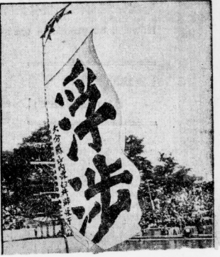
In Japan ist eine neue interessante Sportart erunden worden: das Seegelschwimmen. Der Schwimmer befindet sich an seinem Rücken in einem großen Segel und erzieht so im Wasser bisher unbekannte Geschwindigkeiten.