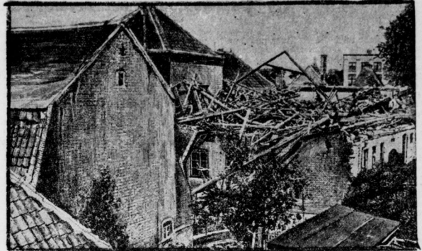
Teile Nordwestdeutschlands wurden dieser Tage von einem Wirbelsturm heimgesucht, der besonders in Meldorf große Verheerungen angerichtet hat. Hier wurden etwa 50 Häuser mehr oder weniger stark beschädigt, alle Bäume entlaubt und in der weiteren Umgebung ein Ansehen tonar vollständig dem Erdboden gleichgemacht. Menschen kamen glücklicherweise nicht zu Schaden. — Unser Bild zeigt die Zerstörungen, die der Wirbelwind in Meldorf angerichtet hat.