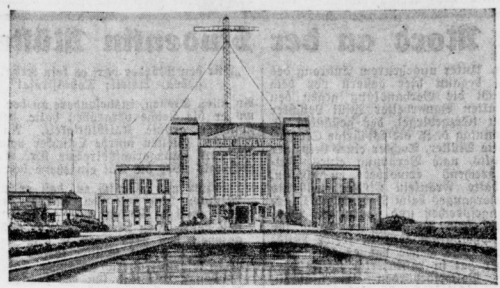
Blick in diesen Tagen auf ein zehnjähriges Weibchen zurück. Am 29. September 1920 wurde sie eröffnet. Mit ihren Antennenrichtungen in die große Funkstation der Welt...