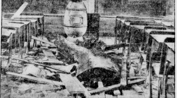
In einem kleinen Orte im Staate Ohio (U.S.A.) durchbrach ein schwerer Baummstumpf, der mit Dynamit in die Luft gesprengt wurde, beim Wiederfallen das Dach eines Schulhauses, erheblich im Schulzimmer, wo gerade Unterricht abgehalten wurde, einen zwölfjährigen Knaben und verletzte den Lehrer u. noch andere Schüler.

ab, nun muß ich für alles sorgen, muß auch jetzt gleich wieder vornehmen, um das Abendbrot zu richten.