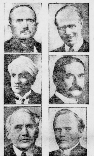
Die diesjährigen Preisträger Linus von oben nach unten: Hans Fischer (Chemie), Sir Norman (Physik), Kellogg (Friedenspreis), 1929, der erst dieses Jahr verliehen wurde.