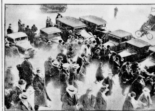
Die Polizei treibt vor dem Kapitol in Washington die Demonstranten mit Tränengas auseinander.

Auch in Amerika sind mit dem Einbruch der allgemeinen Wirtschaftskrise die ruhmreichen Zeiten vorüber. In allen Ländern finden Demonstrationen von Kommunisten und Erwerbslosen statt, die von der Polizei mit Tränengas auseinandergetrieben werden können.