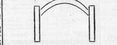
Fig. 1. während sie diese Form haben mußten: