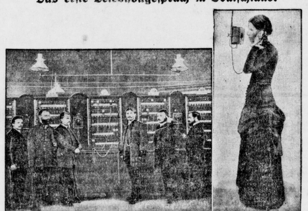
Vor 50 Jahren, im Januar 1831, erhielt Berlin auf Veranlassung des Bahndirektors von Meiningen ein erstes Telnhongepäck. Das Telnhongepäck wurde durch den Telegraphen nach Berlin gebracht.