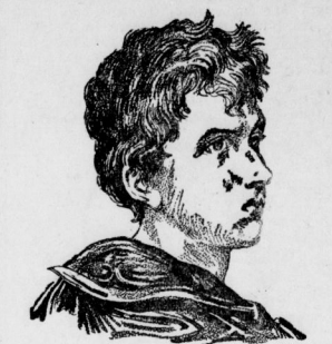
Der Dichter Schlim von Arnim, eine der interessantesten Gestalten der deutschen Romantik, starb am 21. Januar 1831.