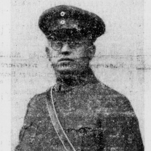
Der erfolgreiche Leiter des Volksbegehrens in Halle, zweiter Führer der Stahlhelms-Organisation.