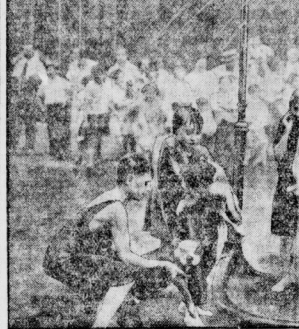
Aufstellungsbüchse für Mensch und Tier in New York.