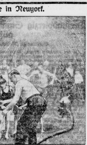
40 Grad Hitze in Neuyork.