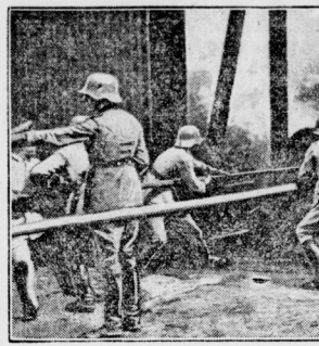
In Altdamm bei Stettin brach in einem Schuppen des Proviantamtes der II. Infanteriebrigade ein Feuer aus, das in den dort lagernden Erbsen- und Getreidesäcken reiche Nahrung fand.