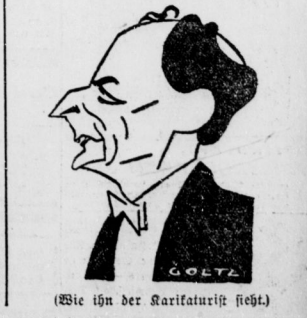
(Wie ihn der Kartaturist sieht.)