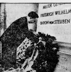
Kranzgießfeier am Steubens-Deintmal in Weymouth.

Die Erinnerung an den deutsch-amerikanischen Freiheitskämpfer General Friedrich Wilhelm v. Steuben wird in diesem Jahr in ganz Amerika gefeiert.