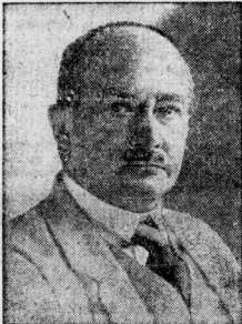
Professor Adolf Windaus, Göttingen

dem es nach mehrjähriger Arbeit gelungen ist, das Vitamin D, das für die Bekämpfung der englischen Krankheit (Rachitis) größte Bedeutung hat, in rein kristallisiertem Zustand herzustellen. Professor Windaus erhielt bereits 1928 den Nobelpreis für Chemie.