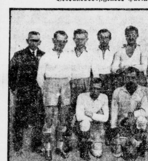
Die zweite Mannschaft der Platzweiche.