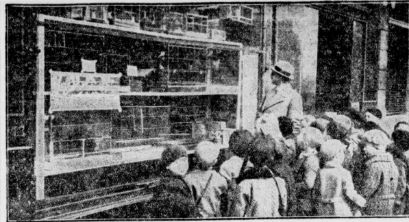
Mit gespannter Aufmerksamkeit folgen diese kleinen AG-Schüler den Erklärungen ihres Lehrers über die Vogelarten hinter der Fensterscheibe.